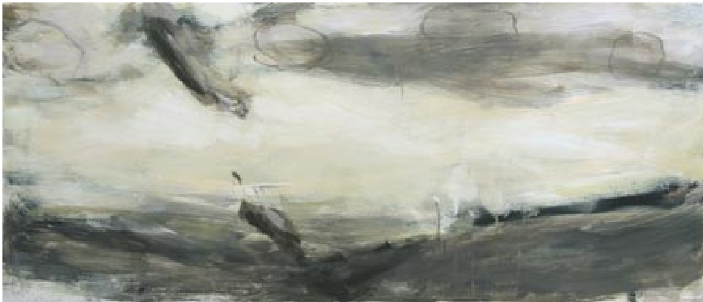
Vrtoče 6/III , 2004, akril/platno, 60 x 140 cm

Rodil se je leta 1969. Leta 1995 je diplomiral na Pedagoški fakulteti v Ljubljani iz likovne pedagogike in slikanja. Poleg slikarstva se posveča tudi kiparstvu in poeziji. Živi in ustvarja v Tolminu in Vrhpolju pri Vipavi.