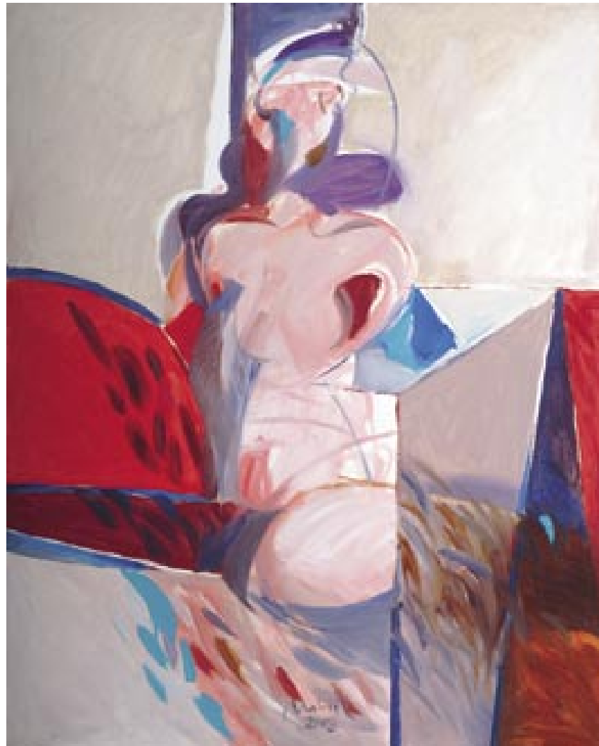
Modri kristal , 2003, akril/platno, 100 x 80 cm

Rodil se je leta 1949 v Vipavi. Leta 1971 je diplomiral na slikarskem oddelku Akademije za likovno umetnost v Ljubljani. Leta 1973 je dokončal specialko za grafiko pri prof. Marjanu Pogačniku, istega leta je pridobil status samostojnega kulturnega delavca. Od leta 1987 predava kaligrafijo in tipografijo na oddelku za oblikovanje Akademije za likovno umetnost. Ukvarja se s slikarstvom, grafiko, kaligrafijo, tipografijo in grafičnim oblikovanjem. Od leta 1970 razstavlja samostojno ter sodeluje na razstavah slikarstva, grafike in oblikovanja doma in v tujini.