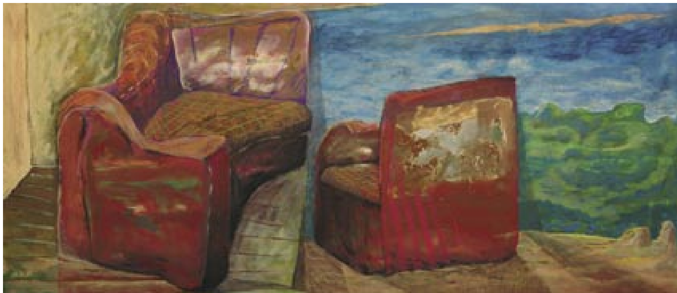
brez naslova , 2004, akril/platno, 75 x 177 cm