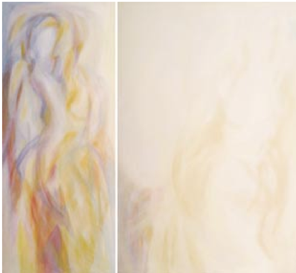
Iz cikla Trenutki čutnosti diptih, 2004, akril/platno, 120 x 130 cm

Rodil se je leta 1961 v Črni na Koroškem. Grafično šolo je končal v Ljubljani. S svojimi deli se je predstavljal na samostojnih in skupinskih razstavah tako doma kot v tujini. Dela Mirana Kordeža govorijo o čutenju, o pojmovanju telesa, ki pa jih avtor hote odmakne v svojstveno figuralnost. Kot samostojni grafični oblikovalec živi in dela v Mirnu.