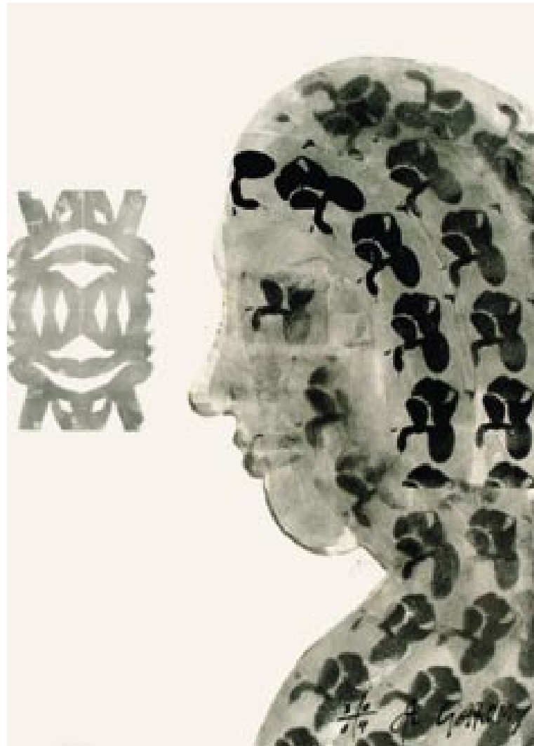
brez naslova , 2004, mešana tehnika/papir, 95 x 67 cm

Živi in dela v Gorici (I). Samostojno in skupinsko razstavlja doma in v tujini.