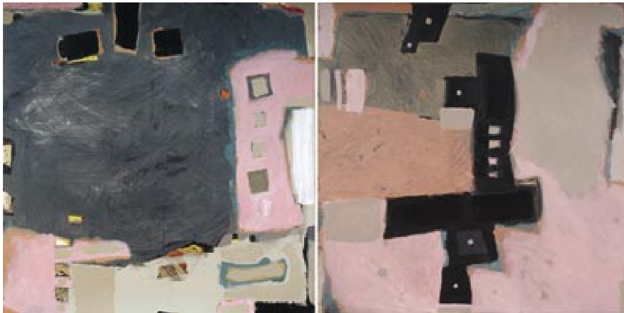
diptih , 2004, akril/platno, 100 x 200 cm

Kot fotograf je izdal ciklus barvnih fotografij z otoka Unije, je avtor fotografije v monografiji Nova Gorica 1976 in Postojnska jama 1983. Poučeval je na Pedagoški gimnaziji v Tolminu in Umetniški gimnaziji v Novi Gorici. Živi in dela v Oseku v Vipavski dolini.