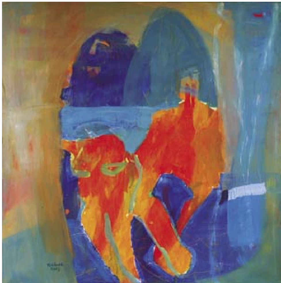
Spomin na jutri II

Rojena je bila leta 1963 v Postojni. Po končani gimnaziji v Ajdovščini je nadaljevala študij in diplomirala na Pedagoški fakulteti v Ljubljani - likovna smer. Razstavlja samostojno in skupinsko doma in v tujini. Živi v Ajdovščini in dela kot profesorica likovne umetnosti na Srednji šoli Venca Pilon.