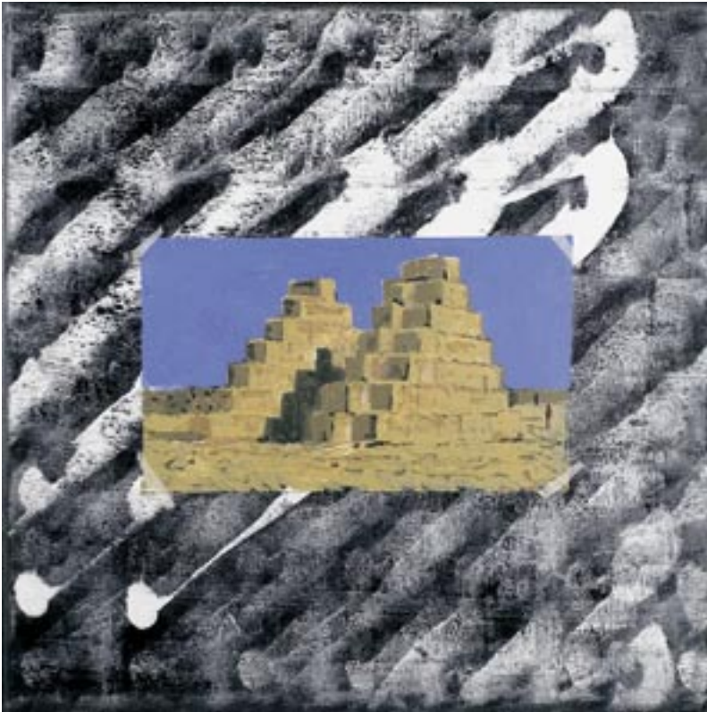
Bez zarez 17 2007, akril, platno, 75 x 75 cm