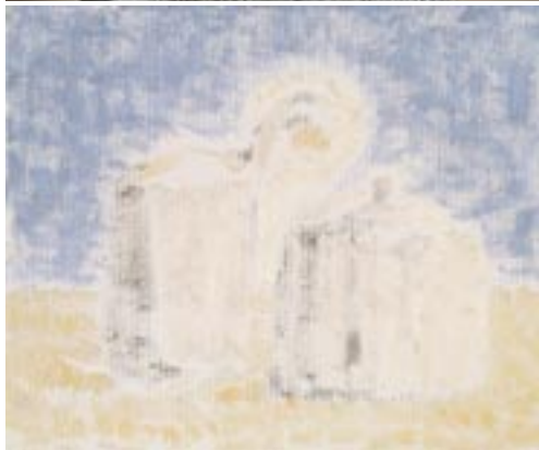
Bez naslova, 2007, kamen, 29 x 36 x 5 cm