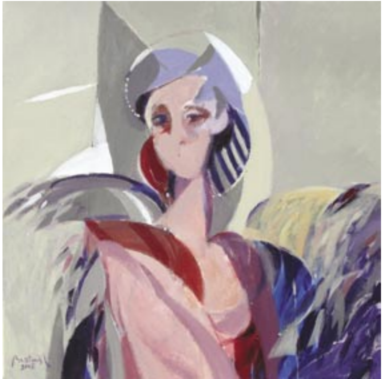
Portret I, 2008, akril, platno, 70 x 70 cm