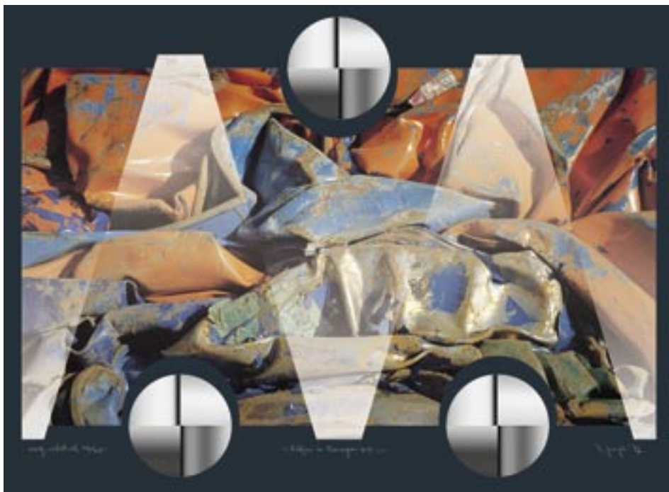
Alfa i Omega XIV, 2007, sitotisak u boji, 60,5 x 83 cm