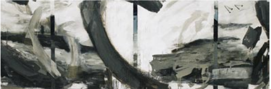
Bez naslova, 2007, akril, platno, 70 x 230 cm