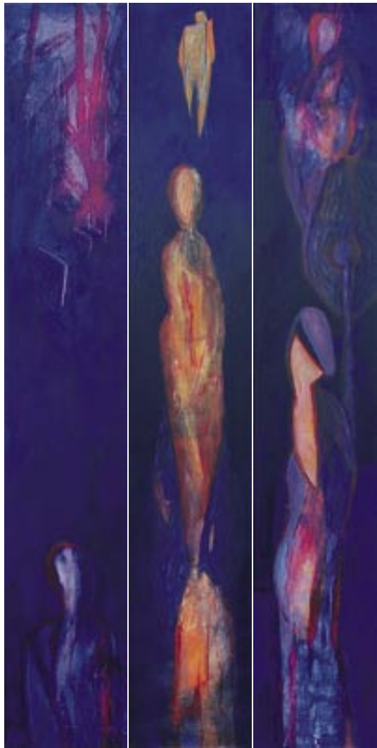
Odjek vremena I, II, III., 2007, akril, platno, 3 x 200 x 30 cm

Rodio se 1953. u Opatjem selu na Krasu gdje živi i stvara još i danas. Diplomirao je na Pedagoškom fakultetu u Ljubljani na odjelu za likovnu umetnost. U studijskom crtanju usavršavao se kod prof. Nikolaja Omerze na Akademiji za likovnu umjetnost. Zaposlen je na Umjetničkoj gimnaziji - likovni smjer u Novoj Gorici. Izlagao je u zemlji kao i u inozemstvu i učestvovao u brojnim slikarskim kolonijama i simpozijama. Član je Saveza društava slovenskih likovnih umjetnika i Društva likovnih umjetnika sjeverne primorske.