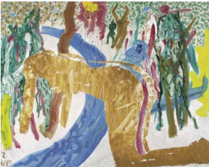
Bez naslova, 2007, ulje, drvena ploča, 70 x 90 cm