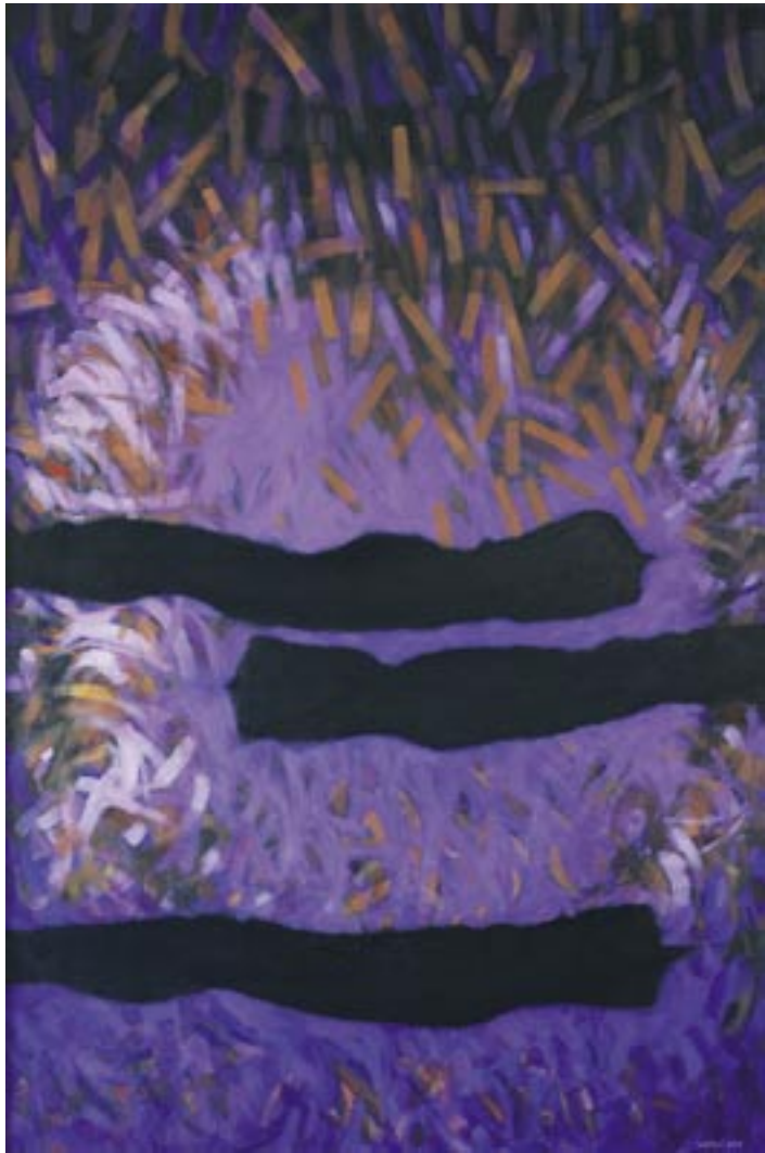
Snovi, 2006, akril, platno, 150 x 100 cm

Rodio se godine 1933. u Kobaridu. Pohađao je školu za oblikovanje u Ljubljani i školu za primjenjenu umjetnost u Zagrebu, gdje je i diplomirao na slikarskom odjelu. Član je Saveza društava slovenskih likovnih umjetnika i Društva likovnih umjetnika sjeverne primorske. Do umirovljenja radio kao likovni pedagog u Kobaridu, gdje još uvijek živi i stvara.