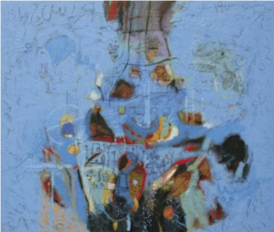
Blago hrama, 2008, miješana tehnika, platno, 110,5 x 130,5 cm