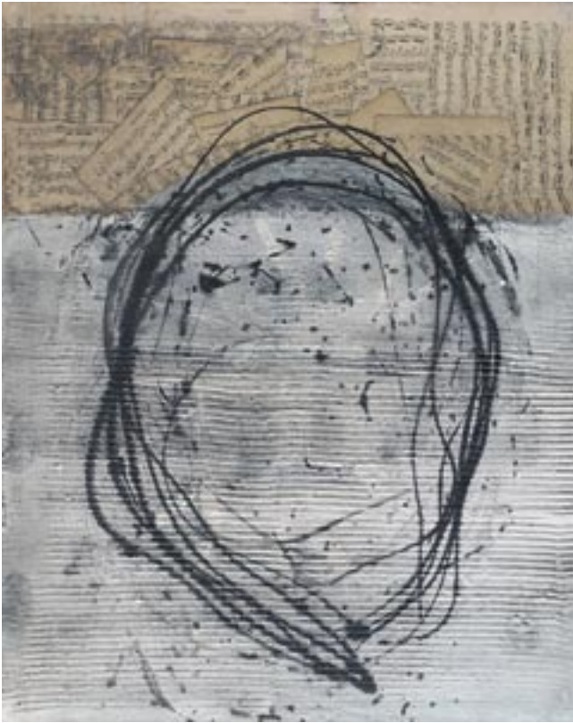
JaSam, 2007, miješana tehnika, platno, 100 x 80 cm