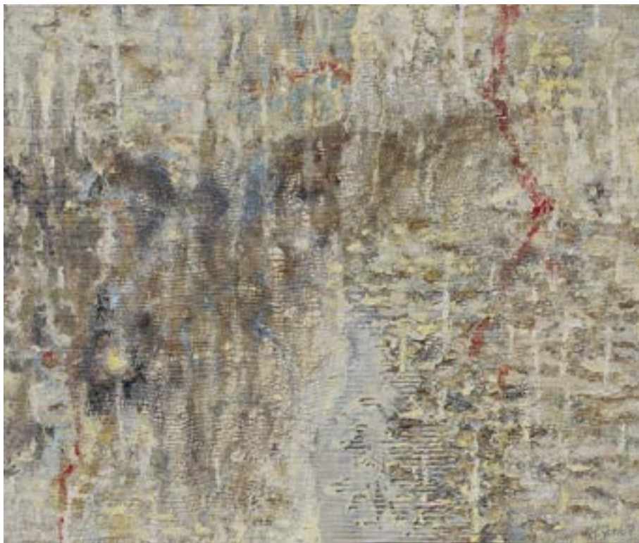
Bez naslova, 2006, miješana tehnika, drvena ploča, 80 x 95 cm