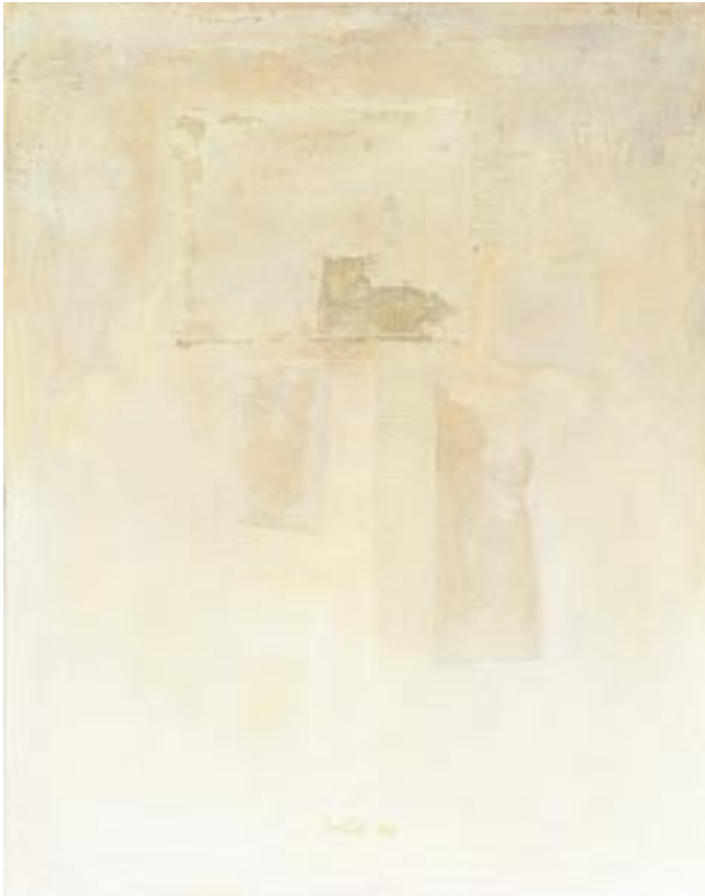
Fragmenti VI 2008, miješana tehnika, platno, 85 x 65 cm