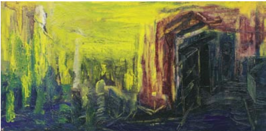
Divlje urbano, 2007, ulje, platno, 60 x 120 cm