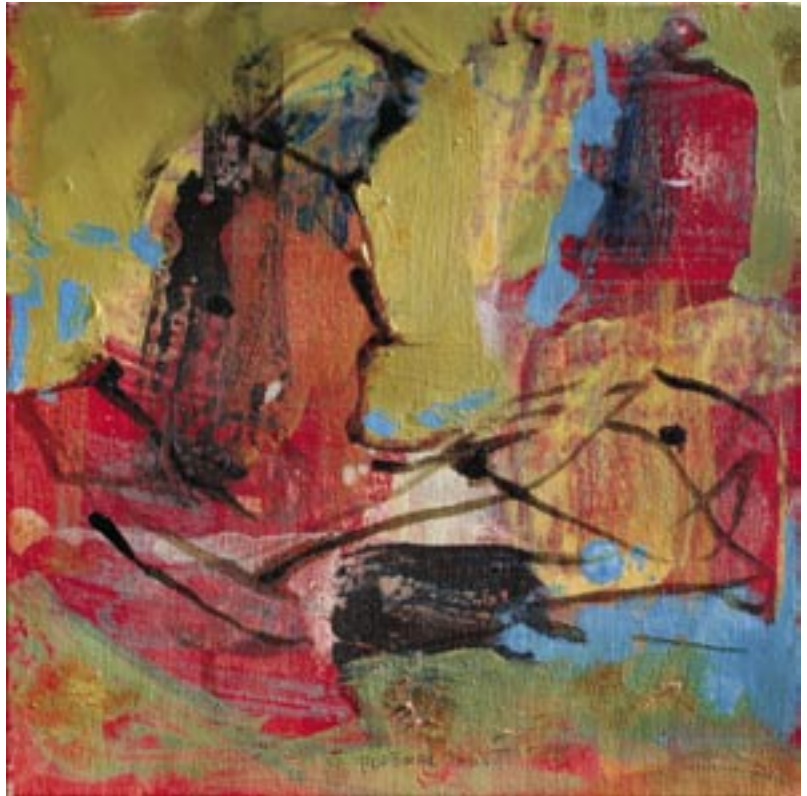
Čudesni hram 2005, akril, platno, 30 x 30 cm