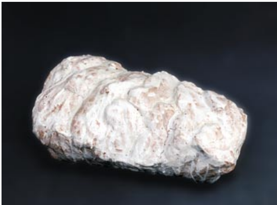
Bez naslova, 2007, keramika, 41 x 23 x 16 cm