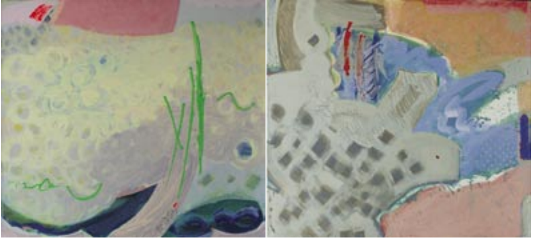
Diptih, 2007, akril, platno, 90 x 200 cm