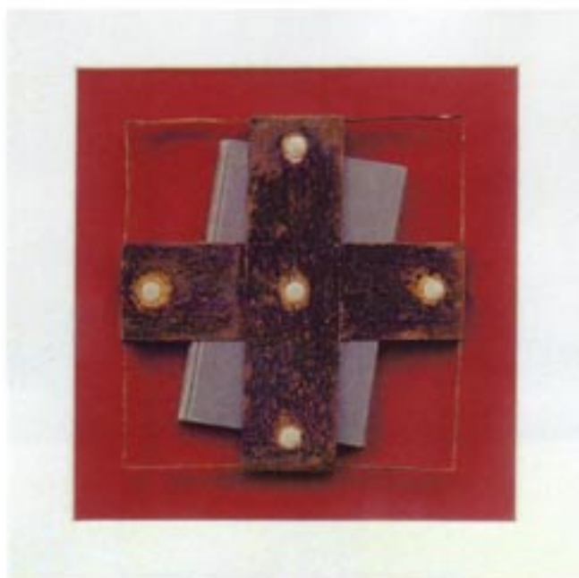
Index librorum prohibitorum mošna tehnika, gemischte Technik 52 x 52