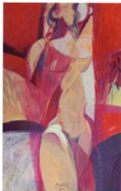
Portret akril / platno, Acryl / Leinwand 110 x 70