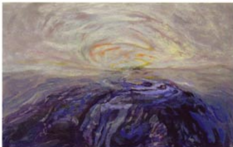
Brez naslova akril / platno, Acryl / Leinwand 192 x 120