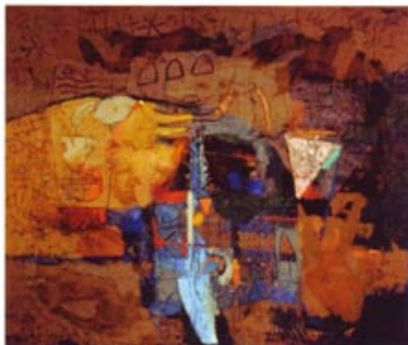
Babilonski fragment IV. akril / platno, Acryl / Leinwand 110 x 130