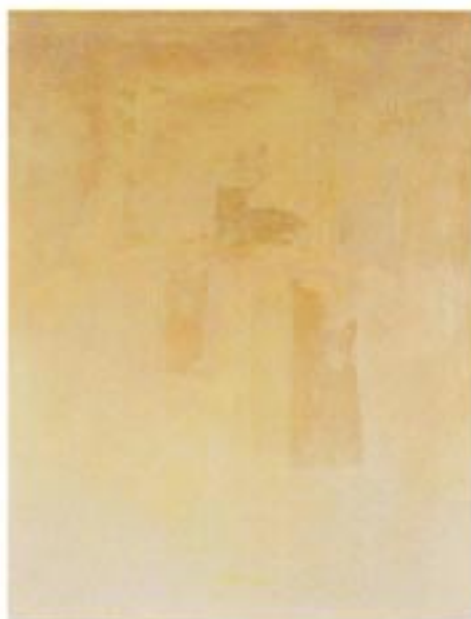
Fragment V mešna tehnika / platno , gemischte Technik / Leinwand 60 x 90 cm