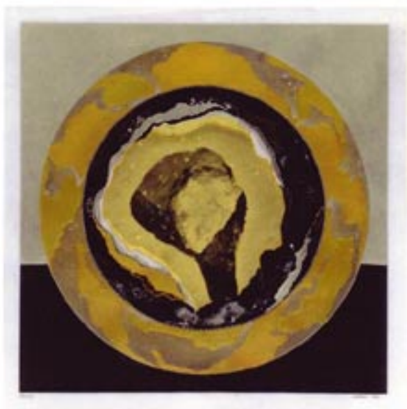
Obrazi mešna tehnika , gemischte Technik 40 x 40