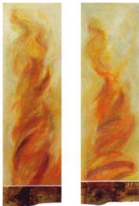
Moja I, II mešna tehnika / platno , gemischte Technik / Leinwand 150 x 40