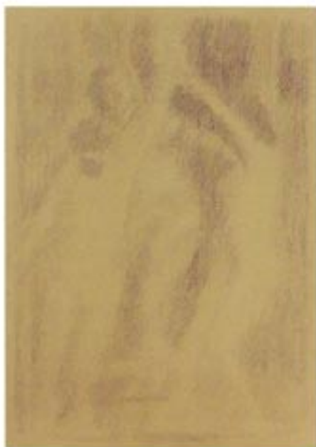
Haritte risba / papir , Zeichnung / Papier 23 x 32 cm