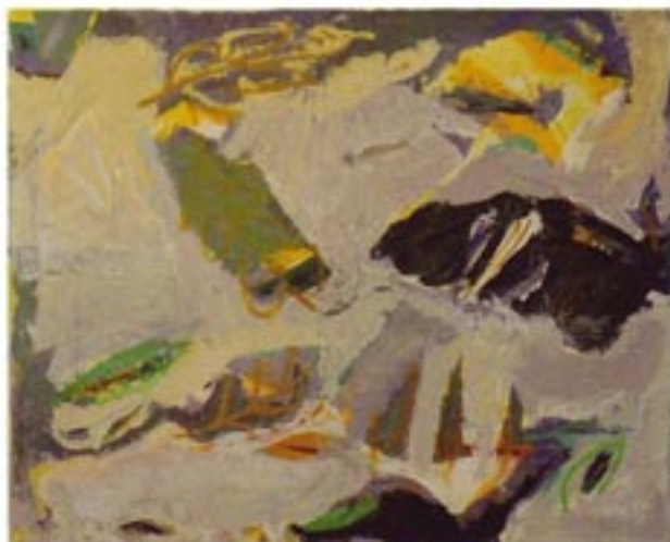
Kras akril / platno, Acryl / Leinwand 80 x 100