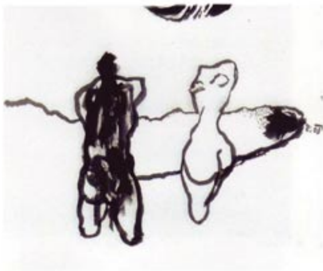
Brez naslova tuš / papir, Tuschkarte / Papier 21 x 29,7