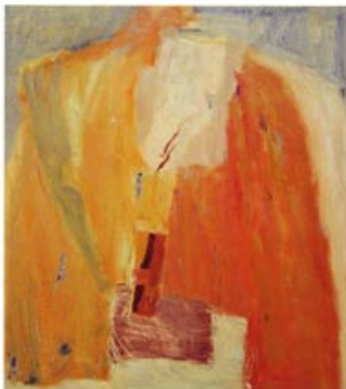
Magična sanjavnost akril / platno, Acryl / Leinwand 80 x 90