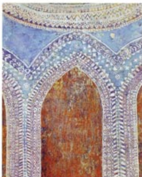
Porta Aurea akril / platno, Acryl / Leinwand 61 x 50