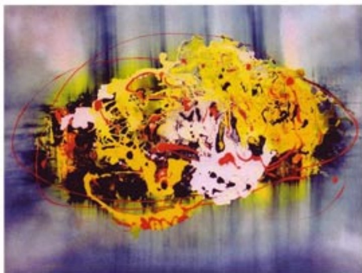
Kompozicija akril / platno, Acryl / Leinwand 52,5 x 37