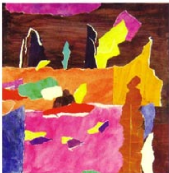
Sanjavo hrepenenje kolaž, Collage 31 x 31