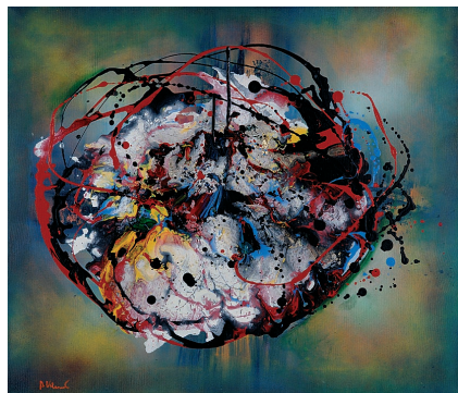
Brez naslova, 2011, mešana tehnika na platnu, 60 x 70 cm

Rodil se je leta 1948 v Gorici (Gorizia) v Italiji. Imel je več samostojnih razstav doma in v tujini ter sodeloval na številnih skupinskih razstavah tako doma kot v tujini. Je član DLUSP. Živi in dela v Gorici.