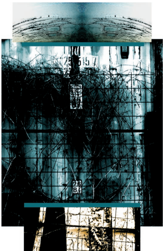
Ovijalka, 2012, digitalni izpis, 83 x 59 cm

Rojen leta 1964 v Postojni. Predstavil se je na več osebnih razstavah tako doma kot na tujem. Svoje fotografije objavlja v različnih publikacijah kot samostojni avtor in kot fotograf Pilonove galerije, kjer je od leta 1988 tudi zaposlen. Je član DLUSP. Živi in ustvarja v Ajdovščini.