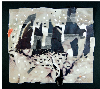
Na preprogi listja, 2007, kolaž na papirju, 20 x 22 cm