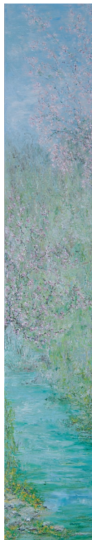
Pomladno prebujanje ob Soči, 2011, olje na platnu, 30 x 180 cm

Rojena 1934 leta v Morskem pri Kanalu. Sodelovala je na številnih skupinskih in samostojnih razstavah. Je članica DLUSP.