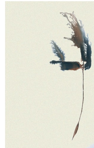
Moj akvarelni prostor, 2012, akvarel, 55 x 38 cm

Rodila se je leta 1967 v Šempetru pri Gorici. Sla po likovnem ustvarjanju jo je vodila na mnoga specializirana usposabljanja, kjer je spoznavala slikarske in grafične tehnike. S svojimi akvareli je prisotna v javnih in zasebnih zbirkah ter na mnogih publikacijah v več evropskih državah. Je članica DLUSP. Živi in ustvarja v Trstu.