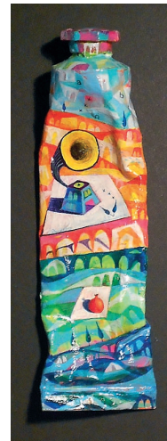
Tuba, 2012, akril, 4 x 12 cm

Rojen leta 1975 v Šempetru pri Gorici. Leta 2000 je diplomiral iz grafičnega oblikovanja na Akademiji za likovno umetnost v Ljubljani. Od leta 2002 pa do leta 2006 je poučeval grafiko na šoli uporabnih umetnosti - Famul Stuart v Ljubljani. Je član ZDSLU in DLUSP. Od septembra 2003 skupaj z ženo vodi likovno oblikovalski center Lična hiša v Ajdovščini.