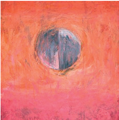
Vibracije zemlje, 2010, akril platno, 80 x 60 cm

Rojena leta 1964 v Ljubljani. Leta 1987 je diplomirala na Akademiji za likovno umetnost v Ljubljani pri Metki Kraševac na smeri slikarstvo. Poleg slikarstva se ukvarja z ilustracijo, mentorstvom likovnikov amaterjev in poslikavanjem sten. Od 1993 do 2003 je živela na Nizozemskem. Je članica DLUSP. Živi in ustvarja na Kamnem pri Kobaridu.