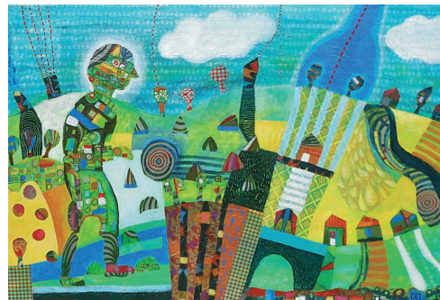
Pogled od zgoraj, 2012, akril na platnu, 40 x 60 cm

Rojena leta 1975 v Ljubljani. Študirala je vizualne komunikacije na Akademiji za likovno umetnost v Ljubljani in leta 2000 diplomirala iz gledališkega plakata. Leta 2005 je magistrirala na oddelku za oblikovanje ALU iz otroške ilustrirane avtorske knjige. Je članica DLUSP. Od septembra 2003 skupaj z možem vodi likovno oblikovalski center Lična hiša v Ajdovščini.