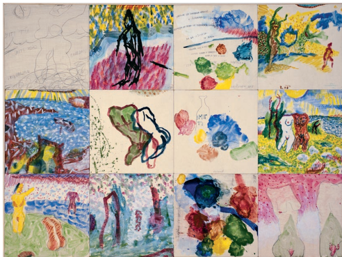
Poletje, 2008, skrivnostne tehnike, 105 x 140 cm

Rodil se je leta 1977 v Ljubljani. Leta 1997 je končal Srednjo šolo za oblikovanje in fotografijo, smer grafično oblikovanje. Leta 2004 je diplomiral iz slikarstva na Akademiji za likovno umetnost in oblikovanje v Ljubljani. Je član DLUSP in ZDSLU. Živi in dela v Trzinu.