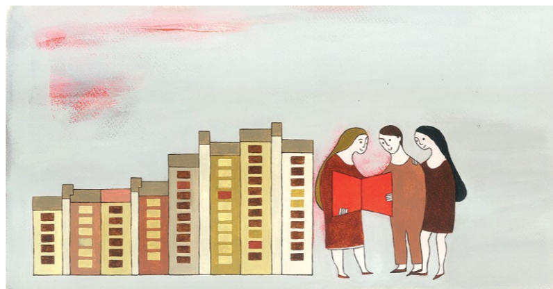
Mesto knjige 2017, akril, 20 x 38 cm

Tinka Volarič je rojena 1980 v Šempetru pri Gorici. Obiskovala je Srednjo šolo za oblikovanje in fotografijo, a jo je želja po znanju s področja humanistike usmerila v študij etnologije in kulturne antropologije. V času študija je ostala blizu likovnemu raziskovanju in ilustrirala prve plakate, zloženke, gledališke liste in knjižne publikacije. Knjižna ilustracija ji je še vedno med najljubšimi; med drugim snuje avtorske slikanice za otroke in odrasle, ilustrira glasbene albume, muzejske vodnike, samostojne konceptualno zasnovane cikle in knjižne naslovnice humanističnih in družboslovnih del. Razstavljala je na več samostojnih in skupinskih selekcioniranih razstavah doma in v tujini. Živi v Mostu na Soči.