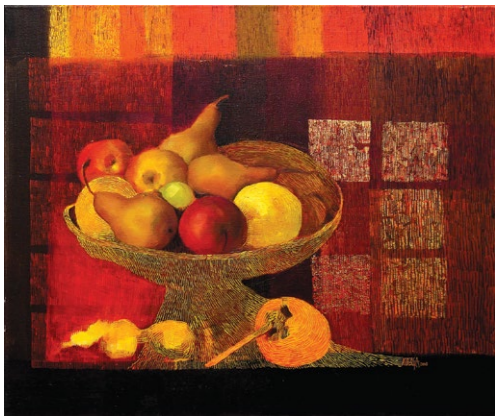
Tihožitje s kakijem, 2008, olje na platnu, 50 x 60 cm

Alina Asberga Nabergoj je rojena 1980 leta v kraju Ogre v Latviji. V Rigi je končala likovno osnovno šolo. Nato se je eno leto učila knjigo-veštva in knjižnega oblikovanja, zatem se je vpisala na srednjo šolo za likovno umetnost in oblikovanje, kjer je uspešno končala 5 letni program »Oblikovanje oglasov in interierjev«. Eno leto je bila zaposlena kot učiteljica slikanja na porcelan in usnje v centru obšolskih dejavnosti v Rigi, nato pa je tri leta delala kot pedagoginja za likovno umetnost v Centru za usposabljanje Saule v Rigi. Od leta 2005 živi in dela v Sloveniji, kjer si je ustvarila drugi dom.