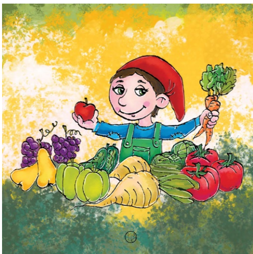
Moj vrt, 2018, mešana tehnika, 20 x 20 cm