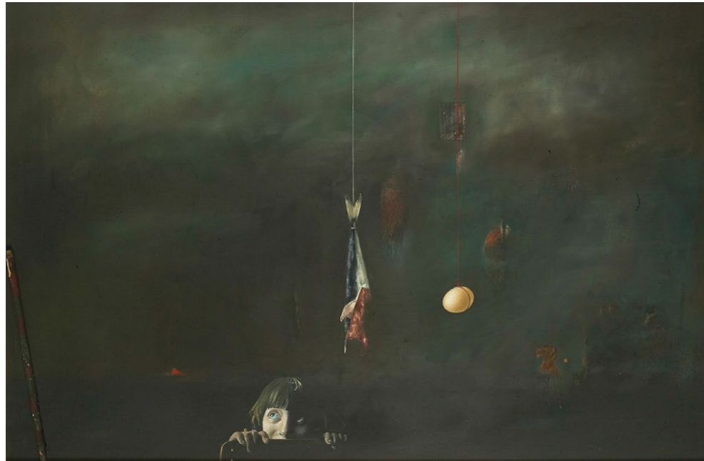
Adolescenza , 1983, olje na platno, 70 x 100 cm