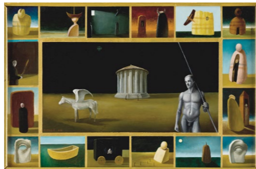
Nokturno , 2000, olje na les 24 x 34 cm

Eva Pavlič Seifert, diplomirana umetnostna zgodovinarica in magistra vizualne kulture