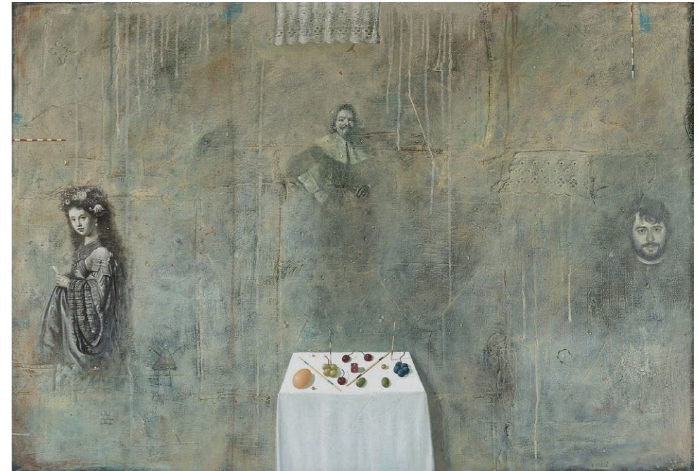
Medanski palimpsest , 2010, olje na platno, 90 x 120 cm