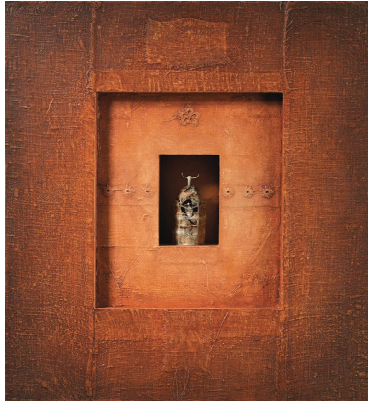
Futura Archaica , 2007, mešana tehnika, 52 x 48 x 8 cm