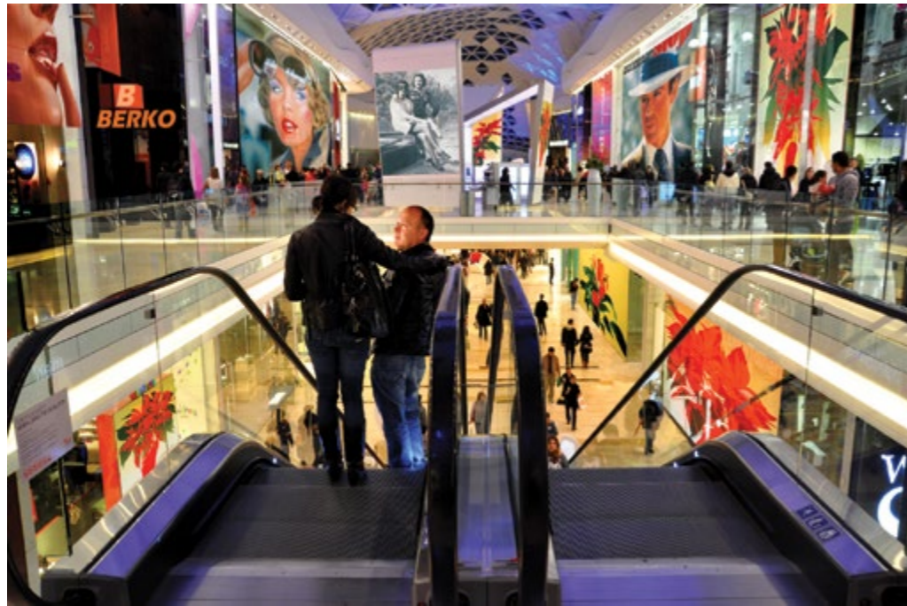
Nikoli niste daleč od Berkove Zvezde Pistoleta, Berko, Murakami-akril, platno, 100 cm x 135 cm