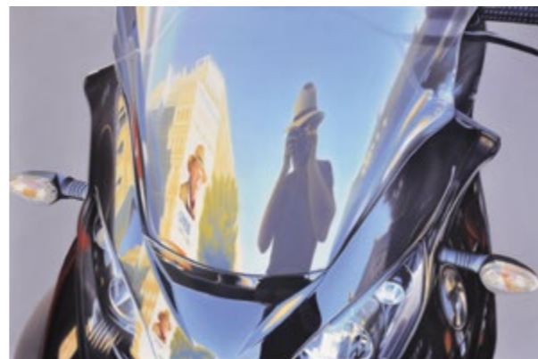
Selfi, 2015, akril, platno, 100 cm x 150 cm

Berko se je rodil 1946 v Ljubljani, kjer je diplomiral na Šoli za oblikovanje in Pedagoški akademiji. Študijsko je potoval v Grčijo (1965), Italijo (1966) in po zahodni Evropi 1973. Od leta 1978 živi kot svobodni umetnik. Avtor nastopa le pod vzdevkom. Slikarsko se je formiral v času poparta in fotorealizma. Berko je eden redkih umetnikov v Sloveniji, ki se je v sedemdesetih letih s fotorealističnim upodabljanjem vsakdanjih motivov zavestno odvrnil od dominantne ekspresionistične prakse in abstraktne slike. Njegov opus od znamenite črno bele slike, na kateri se je upodobil z ženo Zdenko do popularne serije digitalnih grafik in slik velikega formata z naslovom Nikoli niste daleč od Berkove zvezde, obsega še podobe vzete iz družinskega albuma, iz popularnega medijskega sveta, floristične in ekološke motive ter izjemno zanimivo serijo kompleksnih hkratnih pogledov v interier in eksterier, ki se zrcalita v velikih steklenih površinah sodobne arhitekture. Tovrstna trenutna realnost je, ne glede na to, kako je varljiva in dematerializirana, nov vidik v slovenskem slikarstvu kot celoti. Berko slika svoja doživetja in je kronist našega časa, je slikar sodobnosti. Imel je 77 samostojnih razstav in razstavljal na mnogih reprezentančnih razstavah jugoslovanske in slovenske umetnosti ter na mednarodnih bienalih grafike.